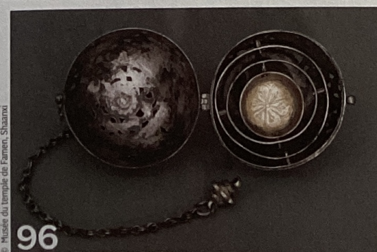
© Musée du Temple de Farnes, Shaanz