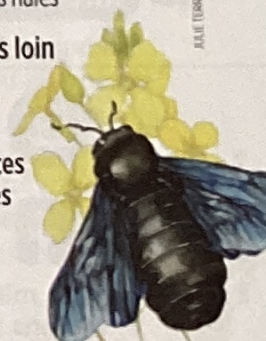
Bestiaire : espèces emblématiques et insolites P. 49