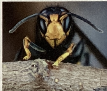
NICOLAS BREDSCHNIG / ALICIA SALE