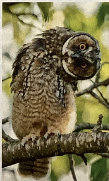
SEBASTIEN MONTHELLE / NATURAGENCY