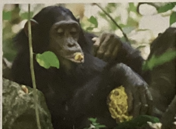
Ils retiennent tout... ou presque! P. 68