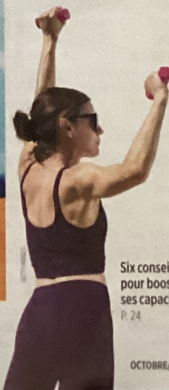
Six conseils pour booster ses capacités P. 24