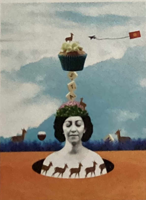
Révisions : inspirez-vous des champions P. 34