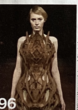
© Iris van Herpen - photograph/Yannis Vlamos