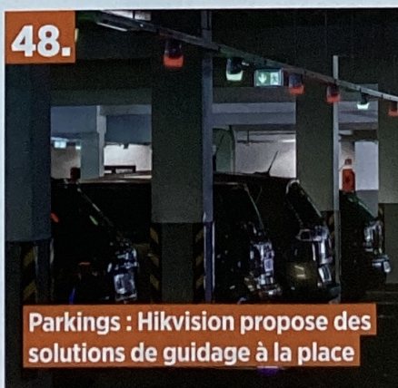
Parkings : Hikvision propose des solutions de guidage à la place