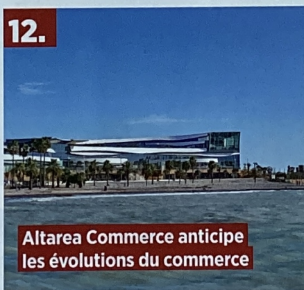
Altea Commerce anticipe les évolutions du commerce