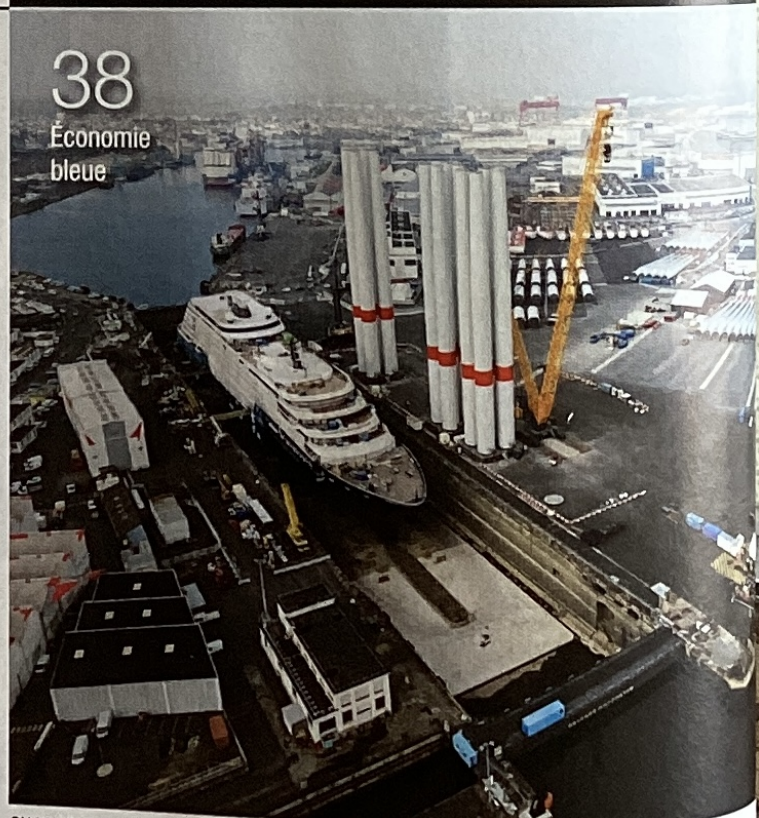
38 Économie bleue

CHAOYANG ZHAO - F. DUBRAY/PHOTOPQR/QUEST FRANCE/MAXPPP - MICHAEL ZACHER - ILLUSTRATION SOPHIE LECLERC D'APRÈS SHUTTERSTOCK - GINA RODGERS/ALAMY/HÉMIS COUVERTURE : MICHAEL ZACHER