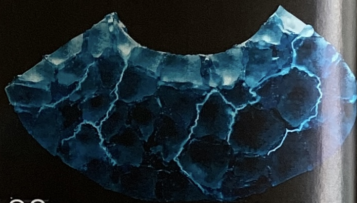
30 Glace électrique

Notre sélection d'actus qui font sourire