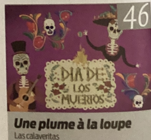
Une plume à la loupe Las calaveritas