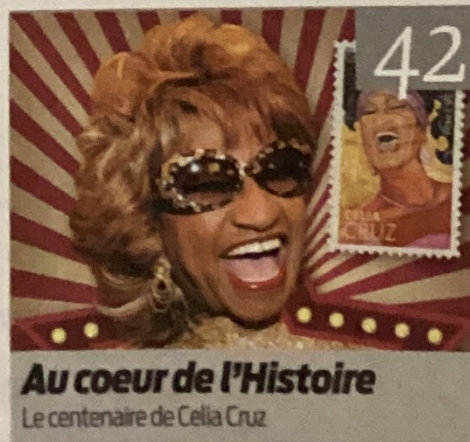
Au cœur de l'Histoire Le centenaire de Celia Cruz