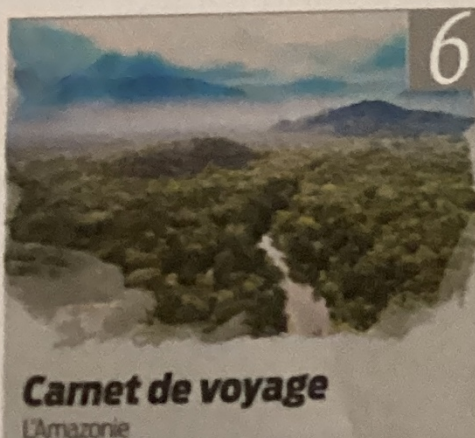
Carnet de voyage L'Amazonie